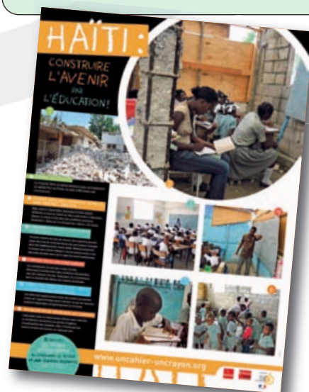
Poster pédagogique de la rentrée solidaire réalisé avec Milan Presse Pour le commander gratuitement : contact@uncahier-uncrayon.org

Modalités, règlement et lexique sur www.uncahier-uncrayon.org