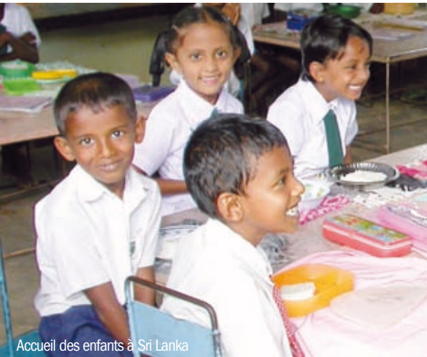
Accueil des enfants à Sri Lanka

Considérée comme essentielle, la prise en charge des plus petits demeure cependant insuffisante dans de nombreux pays. Par l'action de terrain et le plaidoyer, Solidarité Laique réaffirme les enjeux liés à ce secteur.